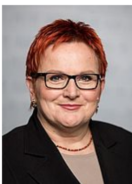
Elke Ferner, MdB

Parlamentarische Staatssekretärin im BMFSFJ