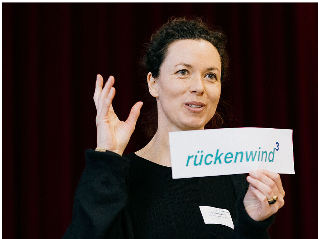
Auftaktworkshop 4 (Ort: Berliner Stadtmission)