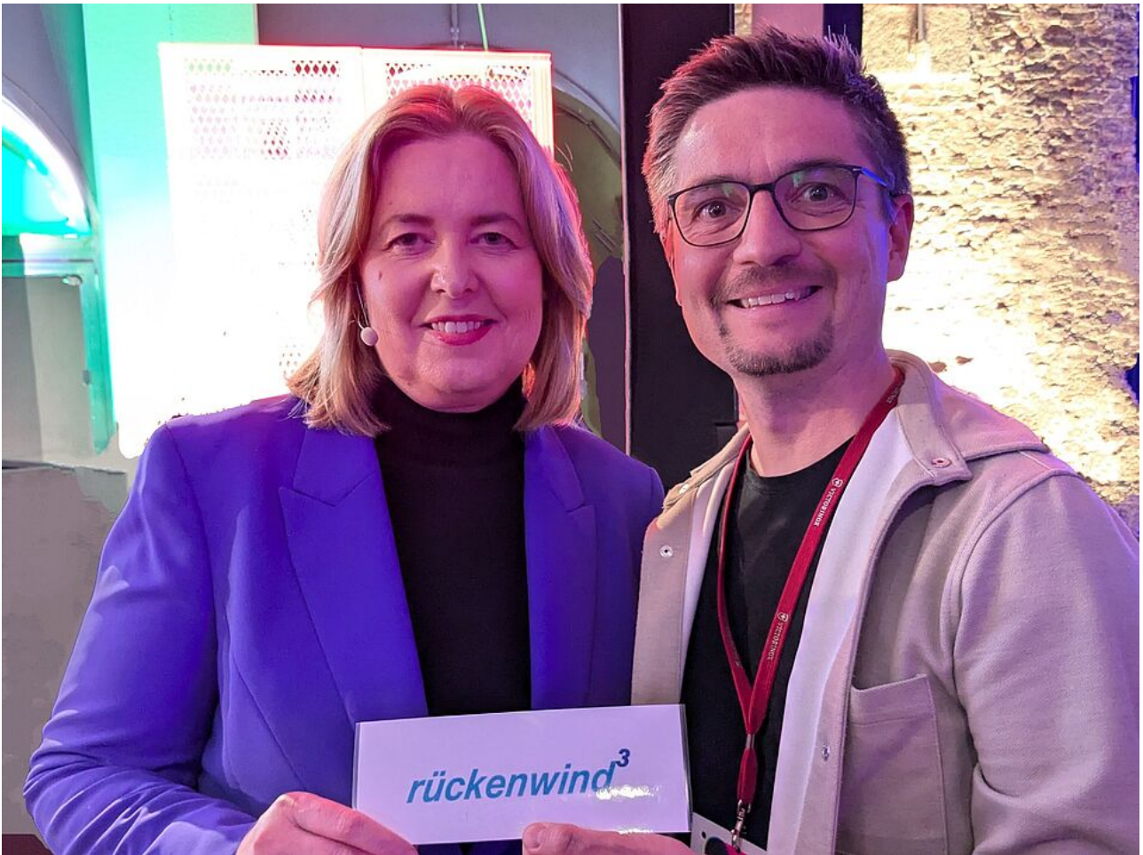
rückenwind 3 auf der republica25

Weitere Informationen zur Arbeit der ESF-Regiestelle sind auf der Programmwebsite www.bagfw-esf.de sowie via X (ehemals: Twitter): @bagfw_esf | #esf_rueckenwind einsehbar.