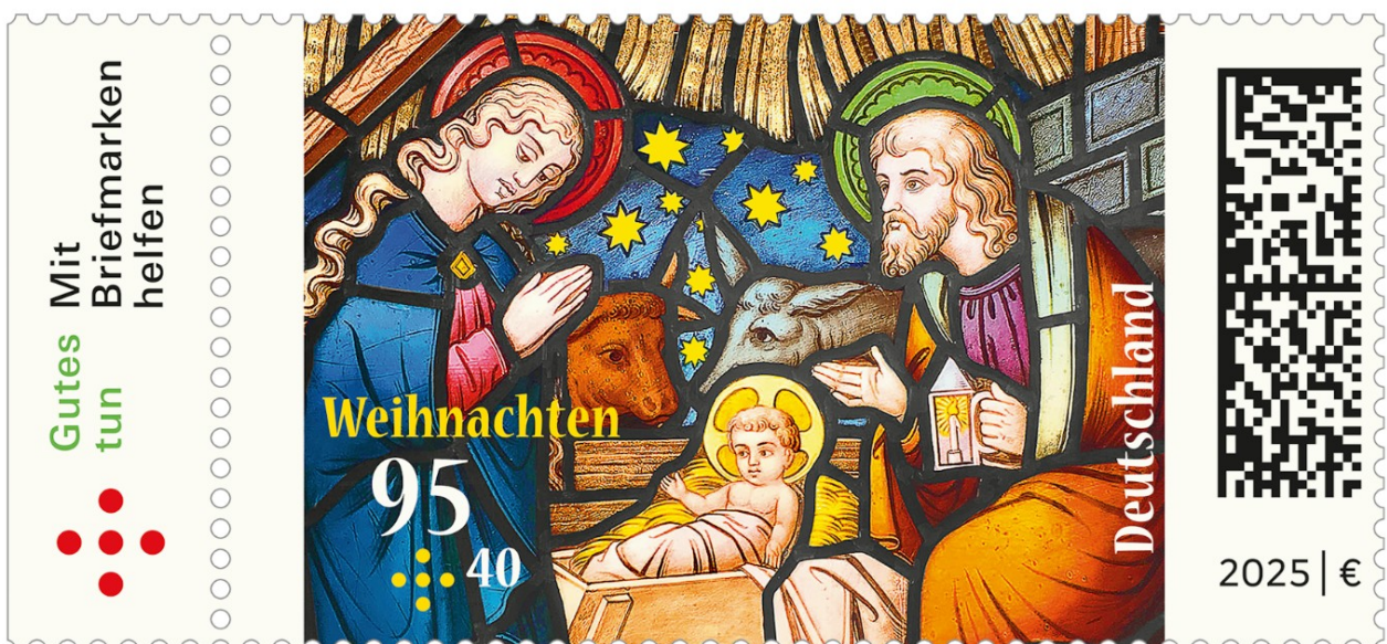
Weihnachtsmarke 2025 „Himmliches Licht – Weihnachten im Kirchenfenster“

Neben der Vorbereitung und Begleitung der Veranstaltungen hat die Abteilung Wohlfahrtsmarken sich in zahlreichen Gesprächen mit den Partnern Bundesfinanzministerium und Deutsche Post dafür eingesetzt, die Rahmenbedingungen für den Absatz der Wohlfahrts- und Weihnachtsmarken zu verbessern.