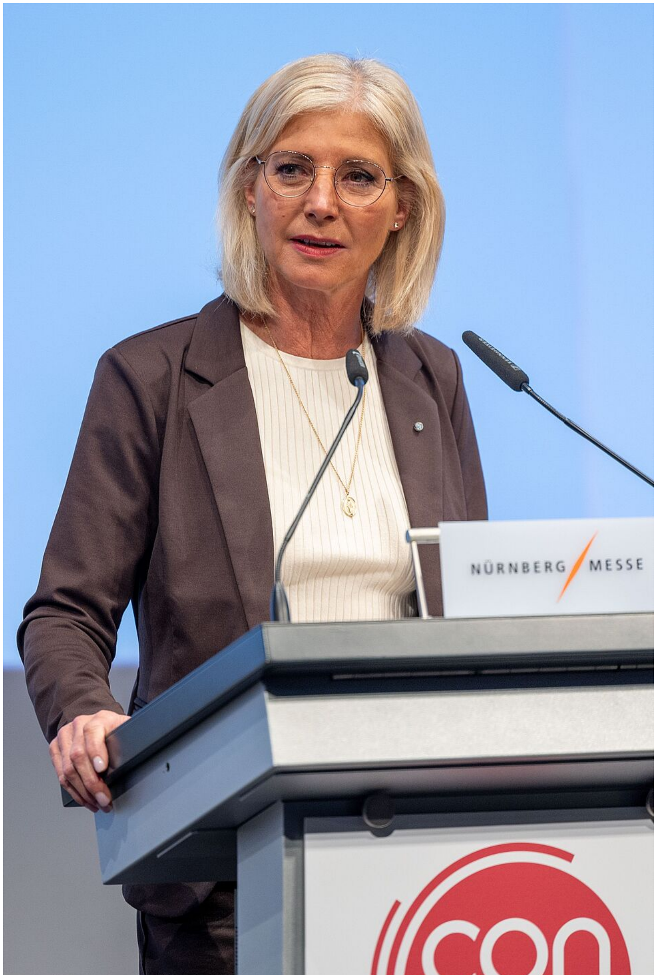
Ulrike Scharf, Bayerische Staatsministerin für Familie, Arbeit und Soziales