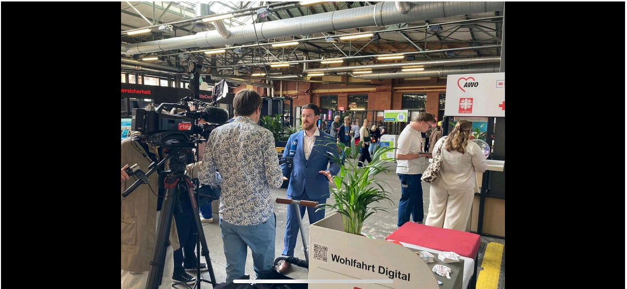
Nachweis: AWO Bundesverband